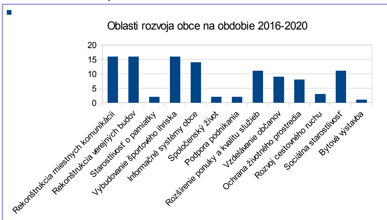
Tabuľka č. 4. Oblasti rozvoja obce

Až 99% z opýtaných plánuje svoju budúcnosť spojiť so životom v obci Slovenské Kľačany.