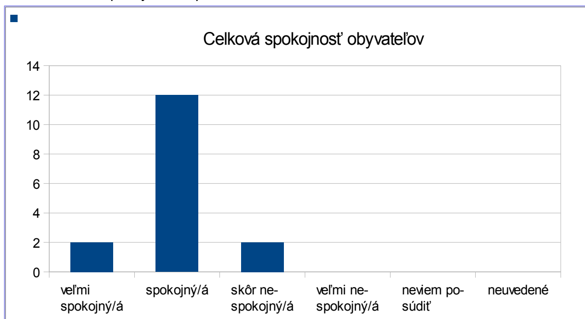
Tab. č. 2 Celková spokojnosť obyvateľov

Nasledujúca otázka smerovala k zisteniu spokojnosti obyvateľov s vybavenosťou obce, pričom respondenti hodnotili jednotlivé aspekty života v obci v škále od 1 do 5, pričom hodnotenie 1 znamená - veľmi spokojný , 5 – veľmi nespokojný.